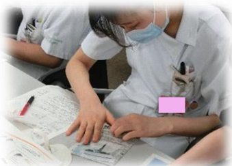
新聞紙を患者の皮膚とし、テガダームを剥がしてみました